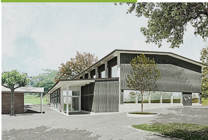
Projektwettbewerb Mehrzweckhalle Lauchetal Ansicht vom Pausenplatz

Wir würden uns freuen, wenn wir Sie und möglichst viele Mitbürger*innen an der kommenden Informationsveranstaltung vom 27. Oktober um 19:00 Uhr über das Bauvorhaben Dorfzentrum Affeltrangen und das Darlehen von Fr. 2.0 Mio. der Politischen Gemeinde, im evangelischen Kirchgemeindehaus in Affeltrangen begrüßen dürften.