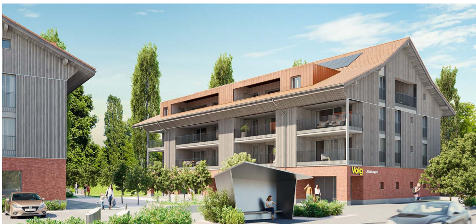
Visualisierung Neubau Genossenschaft Dorfzentrum Affeltrangen

Es ist dem Gemeinderat wichtig, der Stimmbürgerschaft eine neutrale und fachlich kompetente Analyse zum anstehenden Bauvorhaben und dem damit verbundenen Darlehen der Politische Gemeinde, vorlegen zu können.