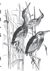
Natur- und Vogelschutzverein Lauchetal

Hecken gehören zu den artenreichsten Strukturen in der Landschaft. Vögeln, Insekten, Reptilien und Amphibien wie auch Kleinsäuger finden darin Schutz, Nahrung und einen Brutplatz. Hecken dienen als Vernetzung in der Kulturlandschaft und als Windschutz.