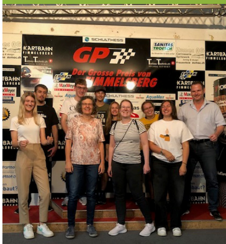
Abbildung: Die Gruppe der Teilnehmenden