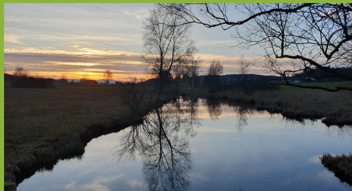
Märwiler Riet, 27. Januar 2024

Ich möchte mich bei Ihnen für Ihre Unterstützung herzlich bedanken. Liebe Mitbürger*innen, Gemeinderat, Werk-, Energie und Umwelt-, Feuerwehrkommission und Gemeindeverwaltung, ich wünsch Euch alles Gute und viel Erfolg.