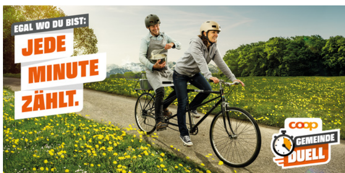
2 Mitteilungsblatt der Gemeinde Affeltrangen

GEMEINDE.MÄRWIL ZEKON.VARBUNDEN.SEIN NAH.BUCH.WERTIG NATÜRLICH.AFFELTRANGEN KLARHEIT.WIR