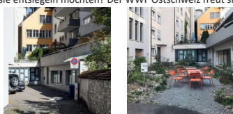
Bildlegende: Nachdem der Asphalt geknackt wurde, blüht es nach nur einem Jahr und es lässt sich verweilen im Innenhof. Copyright: Teto Kluser Fotografie und GSI Architekten

Für weitere Informationen: WWF AR/AI-SG-TG, Lisa-Maria Graf (erreichbar dienstags und mittwochs) Tel. 071 221 72 30 / E-Mail: lismaria.graf@wwf.ch / Webseite: aufbrechen.ch/ostschweiz